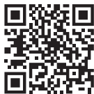
Перечень центров госуслуг